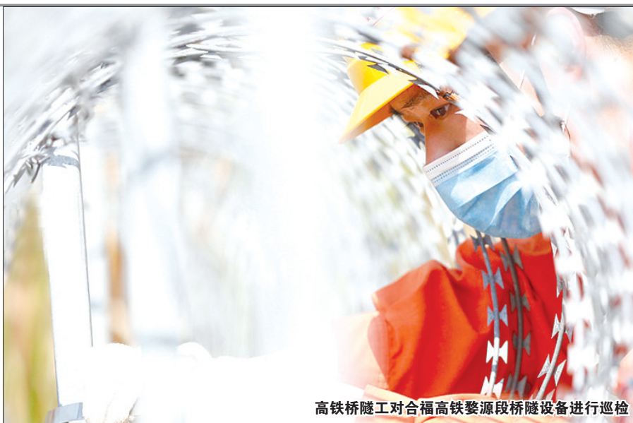
高铁桥隧工对合福高铁婺源段桥隧设备进行巡检

据悉,锦源水厂系吉安市重点项目,设计日供水能力18万立方米。项目分两期建设,一期日供水能力9万立方米,预计2021年4月底试通水,工程完工后将为井冈山经开区提供充足的供水保障,促进吉安经济社会发展。(罗超文 郭熊 熊晓斌)