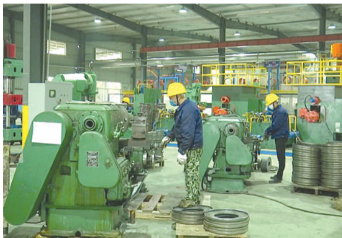
余干县汽配产业园恢复生产

县级专班工作力度虽然不断加大,但是总有难以解决的问题。为此,上饶市建立“全市工业企业项目建设推进会制度”,对于县级层面无法协调解决的问题,由市里统筹解决。推进会每月举行一次,由市工信局在会前做好问题梳理、部门意见征询,统一汇总会上会研究解决,确保推进会目的明确、发力精准。3月10日下午,全市第一次工业企业项目建设推进会召开,