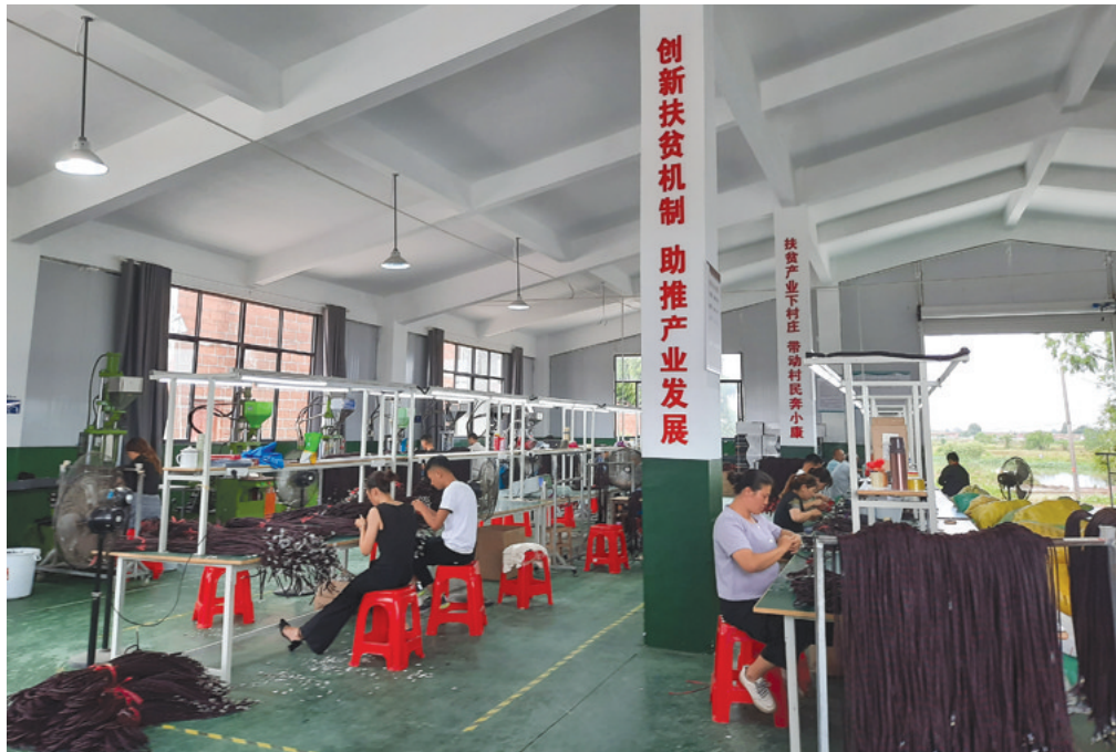
海清电子厂“扶贫车间”