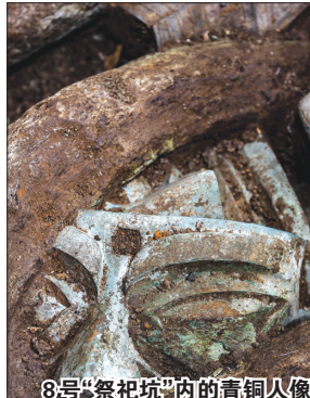
8号“祭祀坑”内的青铜人像