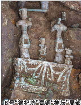
8号“祭祀坑”青铜“神坛”局部