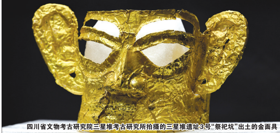
四川省文物考古研究院三星堆考古研究所拍摄的三星堆遗址3号“祭祀坑”出土的金面具

四川省文物考古研究院9日公布了5月以来的最新发掘成果,考古学家们又新发现了500多件文物,其中包括完整金面具、青铜“神坛”、神树纹玉琮等“国宝”。