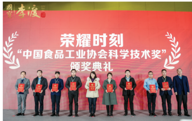
2021年,荣获中国食品工业科学技术奖