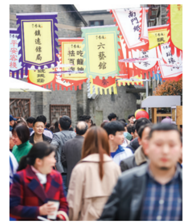
第八届李渡酒业封坛文化节