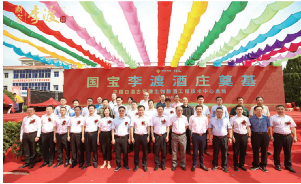
2021年9月29日,国宝李渡酒庄奠基暨中国白酒古窖微生物酿酒工程技术中心启动仪式

福;“最牛二月二·窖醒全龙宴”,国粉们看元代窖池开窖,祭千年酒祖,让传统仪式依然流传于文化脉络;接着拉上同行好友,共同参加首届双人酒王争霸赛;紧随其后的是“非遗扮靓新春,唤醒国粉记忆”的娱乐项目,一场集结了非遗技艺、美酒美食、文创产品和沉浸式体验互动的国宝非遗集市让人一日穿越千年;中午时分,在全息投影餐厅吃上一顿融于传统宋宴的“汤司令的午餐”。 想必这一套流程走完,国粉们便早已沉浸在李渡元代烧酒作坊遗址滋养八百年的酒香里,争相封上一坛献给未来的酒,寄望几十年甚至几十年之后,重温一坛老酒的芬芳。 这种沉浸式互动体验有别于传统的营销方式,它是跟消费者进行沟通的一种方式,是一种基于高品质消费者在自证过程中亲身参与、眼见为实,进而推动品牌打造的立体传播方式。沉浸式体验俨然成为了李渡酒业在行业内的一张名片,为传统白酒产业发展注入了新的活力,而李渡酒业也因此建立了属于自身独有的文化李渡体系,并提炼出“文化李渡”的内涵;在追求卓越品质和打造杰出企业品牌基础上,实现传承古法酿酒和创新现代服务的结合,实现物质消费满意和精神体验满足的结合,实现中国文化挖掘和中华文明传播的结合,进而形成产销相融的新机制,让消费者成为李渡酒业品牌成长的锻造者。