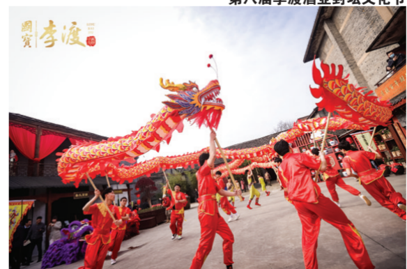
最牛二月二·窖醒全龙宴