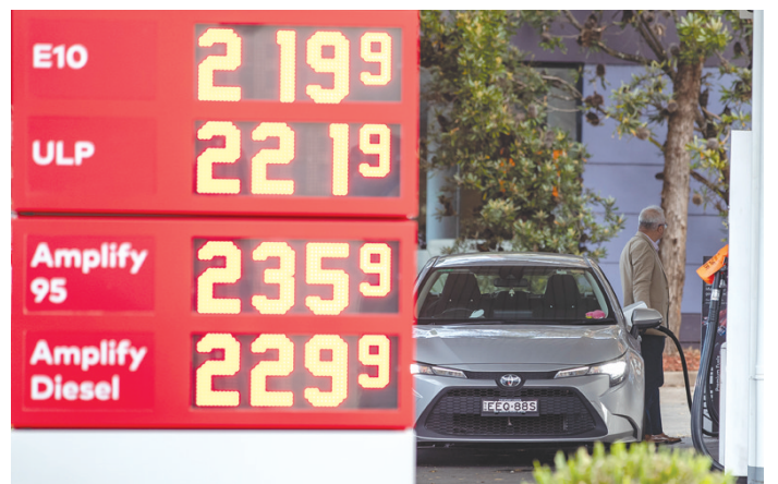
3月14日在澳大利亚悉尼一处加油站拍摄的油价牌 物价格上涨。《澳大利亚金融评论报》14日以食品企业SPC为例报道说,由于通胀导致成本上升,该企业旗下约100种食品供给超市的价格将上涨10%至20%。 悉尼大学经济学家马利亚诺·库利什在接受新华社记者采访时也表示,油价上涨拉高了交通运输成本,消费者不得不缩减其他开支,这影响了消费和投资,不利于经济恢复和增长。 (据新华社)

澳大利亚竞争和消费者委员会14日发布的报告显示,澳大利亚五个主要城市的日平均零售汽油价格在2月底达到每升1.824澳元(约合1.32美元),这是经通胀调整后自2014年以来的最高水平。 这份报告涵盖了悉尼、墨尔本、布里斯班、阿德莱德和珀斯五个城市的油价情况,数据以去年第四季度为主,但由于今年油价继续飙升,加入了截至今年2月的数据和分析。 澳竞争和消费者委员会主席罗德·西姆斯表示,澳零售汽油价格主要由国际成品油价格和澳元对美元汇率决定。原油价格自2020年底以来持续走高,国际成品油价格上涨带动澳油价上涨。 澳昆士兰大学经济学家约翰·奎金在接受新华社记者采访时表示,国际原油价格每桶上涨10美元就会导致澳汽油价格每升上涨约10澳分(约合7.25美分)。 与此同时,油价也带动澳整体