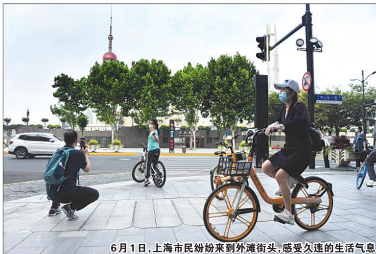
6月1日,上海市民纷纷来到外滩街头,感受久违的生活气息