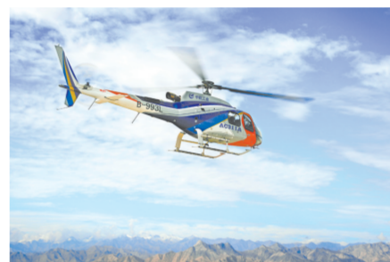
2014年9月8日青海格尔木机场AC311A展翅迎检