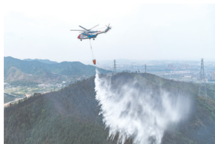
景德镇 AC313 护林灭火