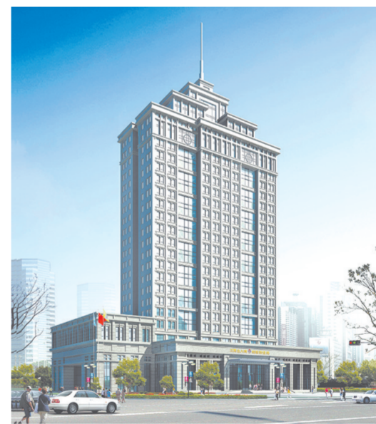
江西省检验检测局综合实验用房(鲁班奖工程)。