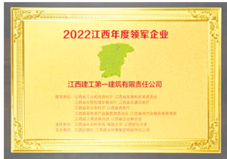
2022江西年度领军企业奖牌。