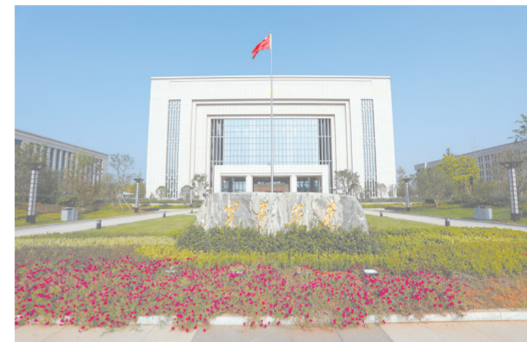
中共江西省委党校整体迁建项目会议中心(鲁班奖工程)。