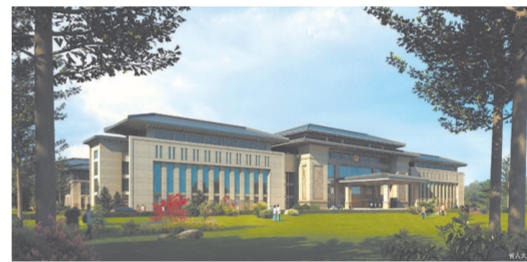
江西省省级党政机关搬迁置换工程项目。