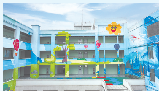
▲临川中阳一中综合楼。