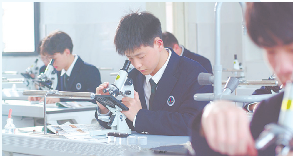
▶临川中阳二中学生实验室上课。