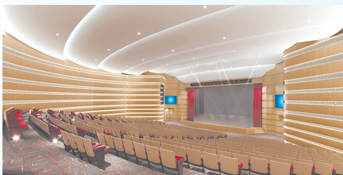
▲临川中阳一中礼堂。