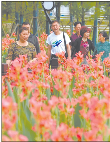
游人在萍乡市翠湖公园赏花游玩。公园内铺设了海绵城市地砖,大大小小的池塘成为城市天然蓄水池,通过系统调控,可以随时蓄水排水。